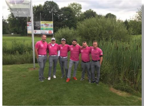
Tabelle: 1. Kaiserhöhe 24 Punkte, 2. Marhördt 19 Punkte, 3. Mudau 14 Punkte, 4. Bad Mergentheim 13 Punkte, 5. Pfullinger Hof 4 Punkte.