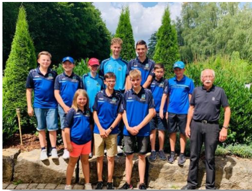
Tabelle: 1. GC Kaiserhöhe (369), 2. GC Cleeborn (381), 3. GC Rheintal (396), GC Bad Mergentheim (400), GC Sinsheim-Buchenauerhof (405).